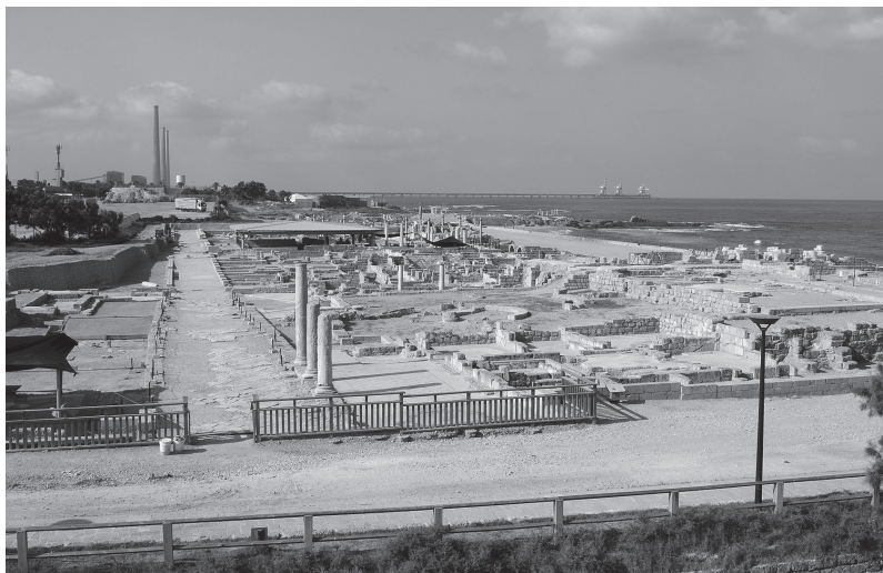
Fig. 1 Shlomo Aronson Architects. Ruinele portului antic Caesarea / The ruins of the ancient port of Caesarea, Tel Aviv, Israel 1992-2006

Cazul parcului arheologic urban presupune o abordare integrată a resursei arheologice și proiectării urbane. Prima situație adusă în discuție este punerea în valoare a ruinelor portului antic Caesarea (Fig. 1) ce datează din anii 30 d. Hr., fiind unul din cele mai importante orașe romane din estul Mediteranei. Intervenția arhitecților constă într-un traseu ce urmărește țărmul Mediteranei, zona de promenadă printre ruine și o grădină arheologică.