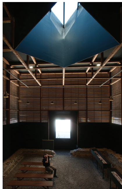
Fig. 10,11 Peter Zumthor, Acoperire pentru protecția unor edificii romane, Coira, Elveția / Switzerland, 1986

The protective close shelters are specific for small, isolated interventions. In Coira (Fig. 10,11), Peter Zumthor has imagined two wooden pavilions as a protective structure of an archaeological jewellery. The scale of the construction allows the understanding of the primary spatial dimensions. These boxes are an abstract reconstruction of roman buildings and try to recall the native height of the spaces they protect. The entrance is almost hidden, suspended, containing a small metal staircase and a door leading the visitor to another dimension. Inside, a series of stairs connect the ground with original level of the site.