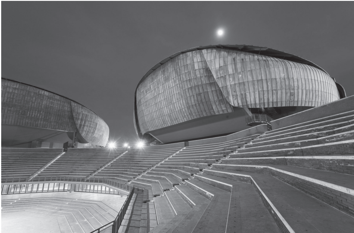
Fig. 8 Renzo Piano Building Workshop - Auditorium e Parco della musica, Roma, Italia, 1997-2002

Auditorium della Musica in Rome is a multifunctional complex for music finished in 2002. (Fig. 8). During construction, the excavations have revealed a Roman dwelling and oil presses dating from the late sixth century. Renzo Piano has redesigned the original structure to accommodate the remains providing a small museum for the artefacts found.