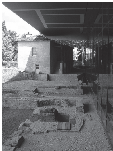
Fig. 6,7 Jean Nouvel - Muzeul Gallo-roman Perigueux / Gallo-roman Museum Perigueux, France, Franța, 1993-2003