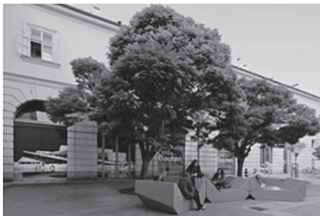
Fig. 1, 2. Exterior View Architekturzentrum Wien, © Hertha Hurnaus