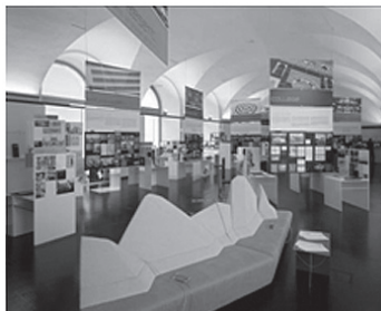
Fig. 3. Architekturzentrum Wien : The permanent exhibition „a_show. Austrian Architecture in the 20th and 21st centuries”