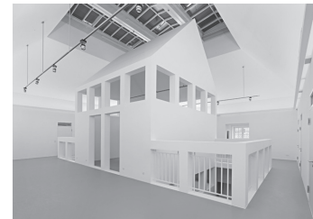
Fig. 13. Local view on permanent exhibition DAM