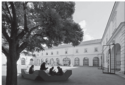
Fig. 1-5: Courtesy Az W Press, Ines Purtauf / Irene Jaeger, ARCHITEKTURZENTRUM WIEN / Courtesy Az W Press, Ines Purtauf / Irene Jaeger, ARCHITEKTURZENTRUM WIEN