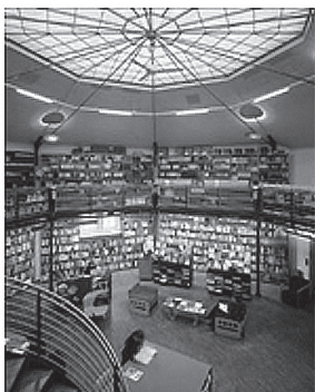
Fig. 4. The Architekturzentrum Wien's library