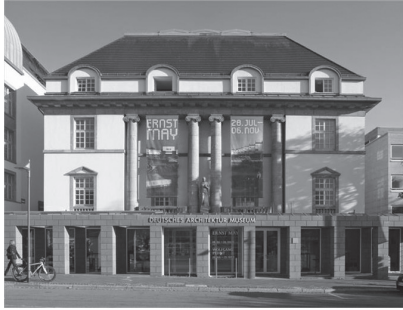
Fig. 6-14.