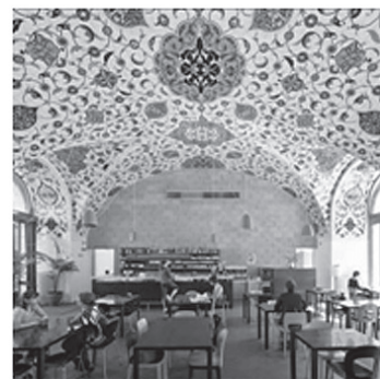
Fig. 5: The Café-Restaurant „CORBACI” at the Architekturzentrum Wien