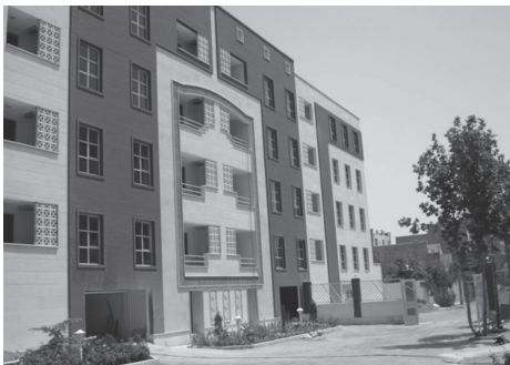
Fig. 5 Disciplină / Discipline