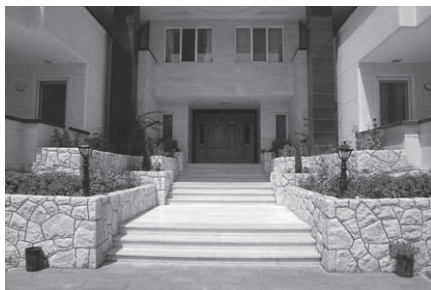
Fig. 3 Intrarea unei clădiri în nordul Teheranului / The entrance of a building, north of Tehran

Balconul: nu trebuie să pară ceva instabil și temporar în percepția cetățenilor. Cu atât mai mult în cazul copiilor, pe care instabilitatea îi sperie. (Afshar Naderi, Kamran, 2004, p.3)