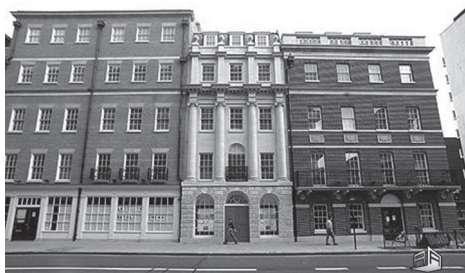
Fig. 8 Proximitate prin stil (ferestre și uși) / Proximity by style (windows and doors)