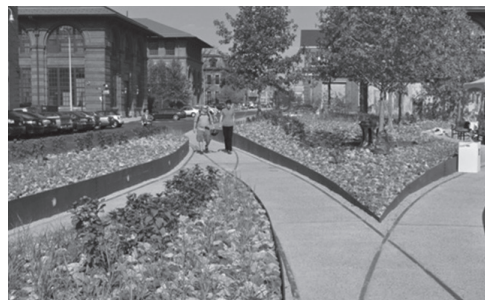
Fig.12 Crearea de spații verzi ca locuri de recreere în cartier / Creation of green space as recreation spaces in the neighbourhood