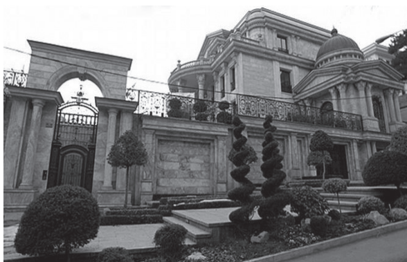
Fig. 1 Construirea fațadei ca indicator al situației social-economice a proprietarului din Teheran / Building facade as an indicator of the owner's social-economical situation in Tehran