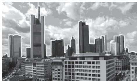
Fig. 9 Ritm dinamic în spațiul urban / Dynamic rhythm in urban space