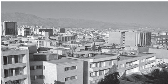
Fig. 11 O imagine urbană revoltătoare a zilelor noastre: partea de sud-vest a Teheranului / An outrageous urban image of nowadays: the south west area of Tehran