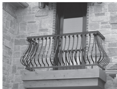
Fig. 4 Balconul unui apartament în Teheran / Balcony of an apartment in Tehran

Balcony: It shouldn't seem unstable and temporary situation in citizen's views, especially in the case of children, who generally get scared by instability. (Afshar Naderi, Kamran, 2004, p.3)