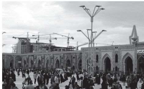
Fig. 6 Moschee în Iran. Unitate de siluetă prin armonizarea dintre marginile acoperișului și silueta orașului / Mosque in Iran. Unity by coordi- nation between roof edges and skyline