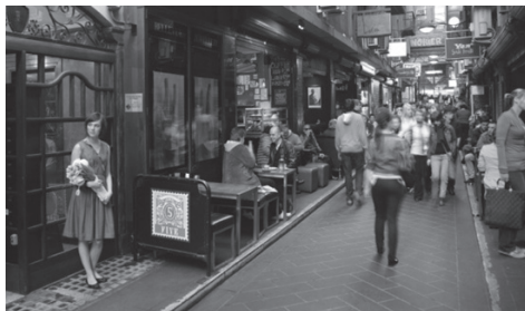
Fig. 7 Scara umană într-o zonă pietonală din Anglia / Human scale in a pedestrian area in En- gland