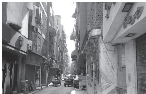
Fig. 2 Rolul fațadelor clădirilor urbane / The role of the urban buildings facades