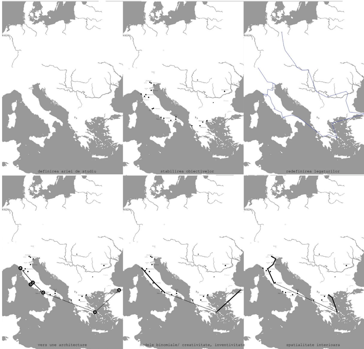
Principiile alcătuirii hărților specifice și construcția modelului / Composition principles of the specific maps and the model construction.