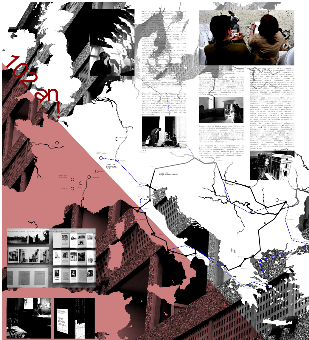
Traseu workshop VOR. Relația cu traseul inițial realizat de Le Corbusier în 1911 / VOR workshop path. Relationship with the initial route followed by Le Corbusier in 1911