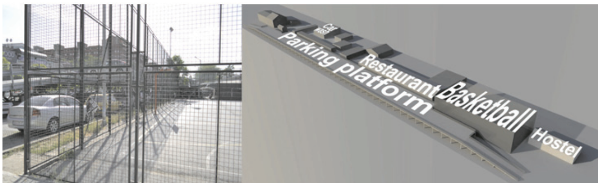
Fig. 4. Coridorul Bulevardului de Sud – Medierea spațiilor libere / Southern boulevard corridor – Void mediation