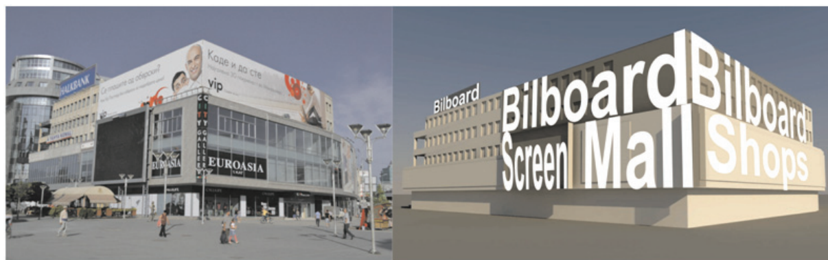
Fig.2. Centru comercial – Medierea simbolică / Shopping center – Symbolic mediation