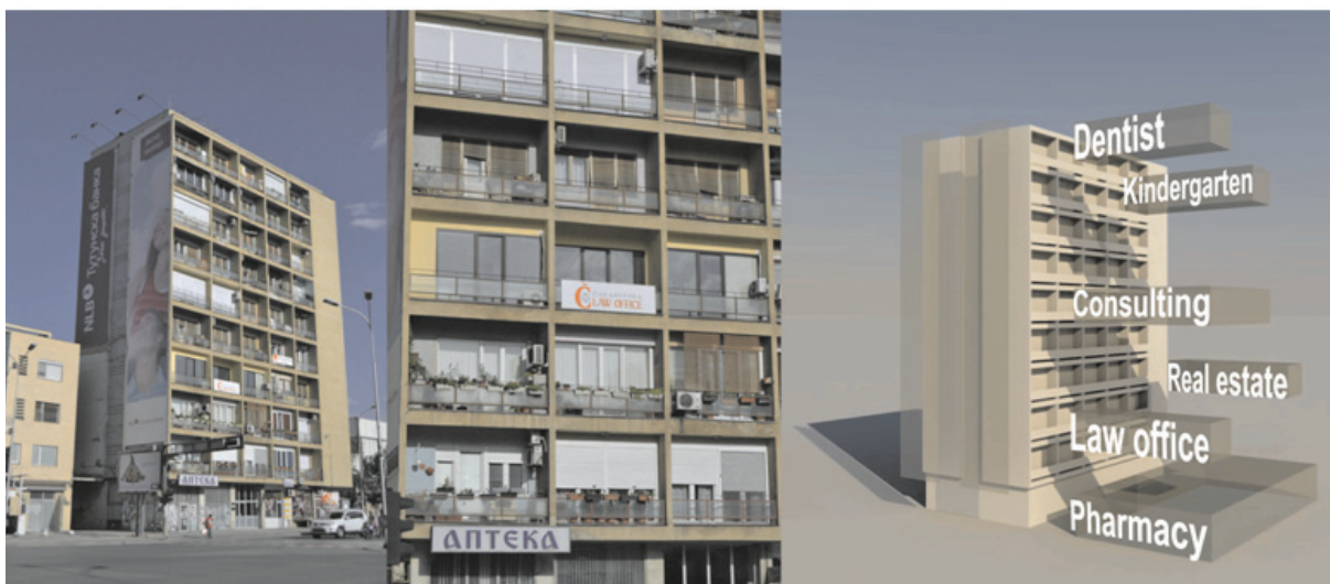
Fig.1. Bloc de apartamente – Medierea la nivel de program / Apartment block – Program mediation