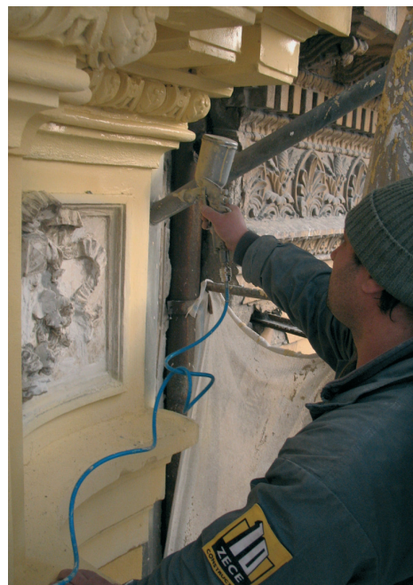
Montarea și vopsirea consolelor / Mounting and painting the consoles