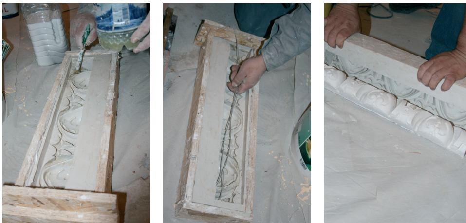
Turnarea decorațiilor / Moulding the decorations

Lucrarea nu a necesitat costuri pentru achiziția materialelor mai mari decât cele presupuse de soluțiile moderne. Manopera este într-adevăr mai laborioasă și necesită o calificare mai înaltă a lucrătorilor comparativ cu aplicarea unui strat de vopsea cu trafaletul - soluție necorespunzătoare dar din păcate larg răspândită în intervențiile la fațadele construcțiilor vechi.