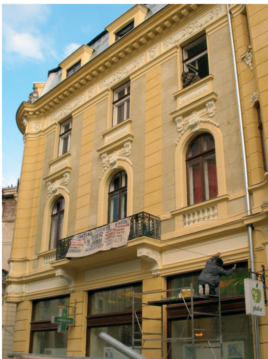
Fațada la încheierea lucrărilor / The façade at the end of works