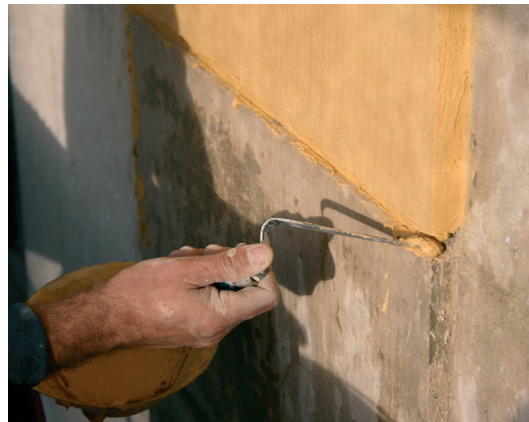
Aplicarea mortarului de var / Application of the lime mortar

În zona de câmp nuturile din tencuială s-au realizat cu zgârieziul "pe ud".