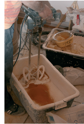
Prepararea mortarului de var cu pigment / Preparation of the lime mortar with pigment

Pentru conservarea fațadei, la recomandarea expertului restaurator s-a ales un finisaj din mortar de var cu nisip pentru zonele de câmp și de mortar de var cu praf de piatră pentru coloanele angajate și cornișe. Decorațiile au fost finisate cu vopsea silicatică pentru a se asigura permeabilitatea fațadei.