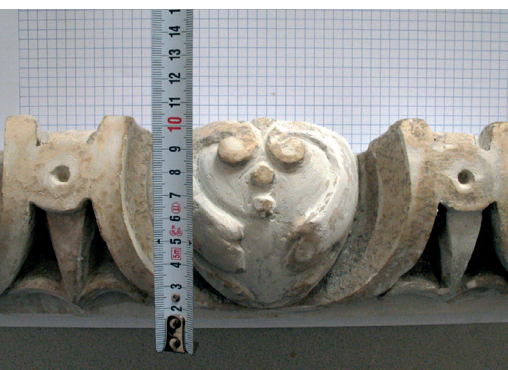
Realizarea matriței pentru decorații / Realization of the decorations' mould