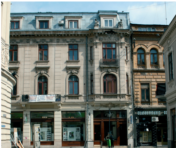
Starea fațadei la momentul începerii lucrărilor / The facade condition at the beginning of works