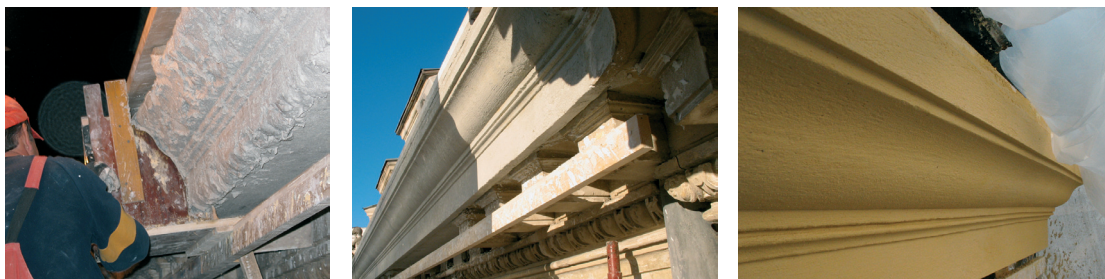
Cornișă „trasă” cu șablonul / Tracing the cornice with the mould