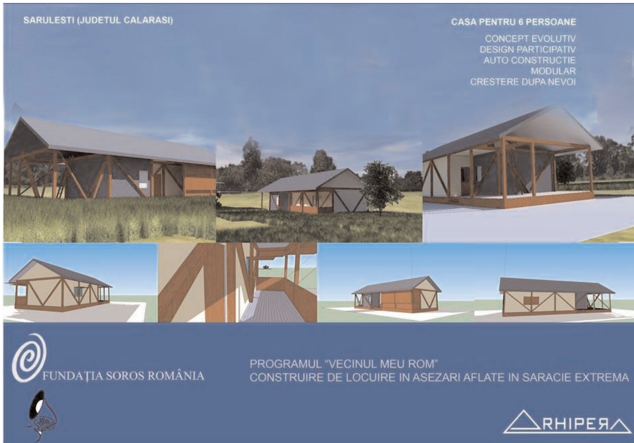
Concept ARHIPERA pentru o locuință socială evolutivă în Sărulești (jud. Călărași) / ARHIPERA concept for an evolutive social house in Sărulești ( Călărași county)

Dacă, dimpotrivă, arhitecții își vor pune cizmele de cauciuc și vor face arhitectură acolo unde ea nu există, atunci arhitectura va începe să conteze nu numai ca un sector destinat elitelor (din ce în ce mai puține), ci și maselor sărace (din ce în ce mai numeroase), iar munca și efortul lor va contribui la diminuarea sărăciei. Această schimbare este necesară și posibilă.