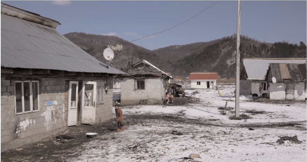
Vânători, jud. Neamț, 2010 / Vânători, Neamț county, 2010

(jud. Călărași), de exemplu. Iar preluarea unor exemple de bune practici din mediul rural și încercarea de a adapta metodologia la contextul urban se pot dovedi nefolositoare, iar rezultatul incert.