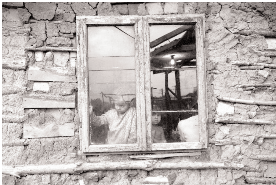
Bălțești, Ursărie, jud. Prahova, 2007 / Bălțești, Bear leaders gipsy community, Prahova county, 2007