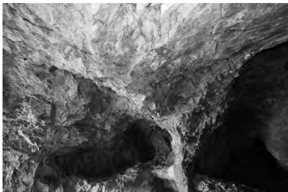
Galerie exploatată prin tehnica "foc și apă", Văidoaia, Roșia Montană