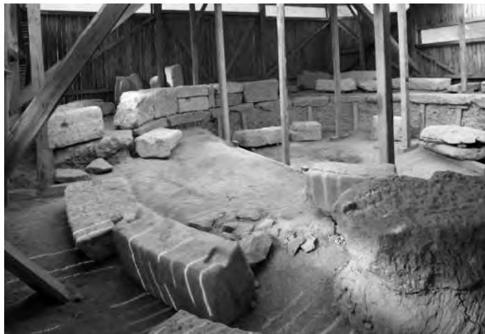
Monument circular roman