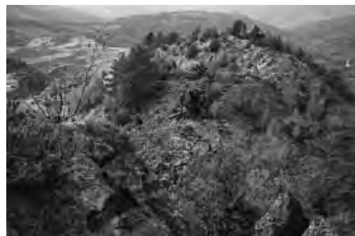
Vârful masivului Cârnic