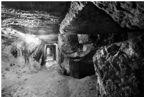
Galerie vizitabilă în Muzeul mineritului