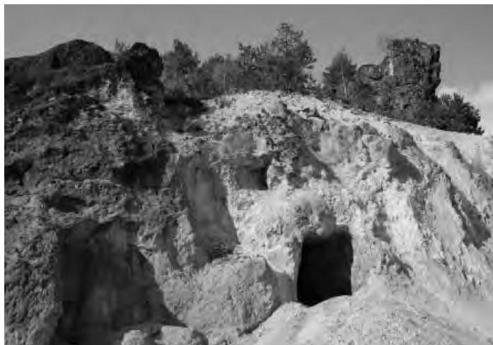
Acces în mină