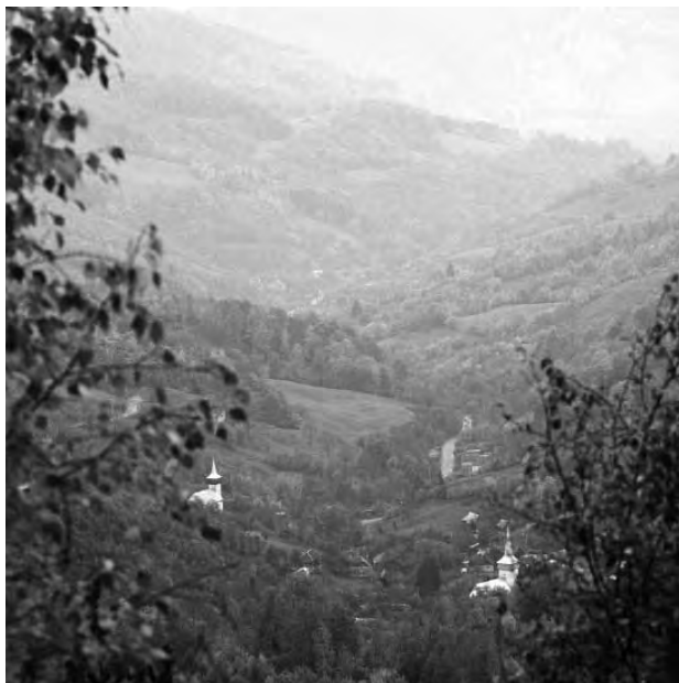
Valea Cornei urmează să fie transformată în iaz de decantare