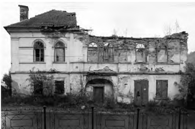
Monument istoric în colaps