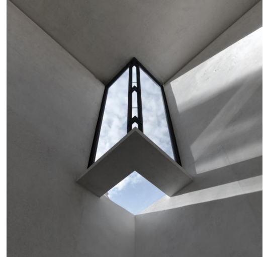
Fig. 2. Fereastrele concepute de către Carlo Scarpa pentru galeria Gipsoteca Antonio Canova, ca extindere a muzeului din localitatea Possagno din Italia, dețin misiunea de a consolida experiența lumii exterioare. Prin intermediul lor și implicit al luminii cunoaștem și observăm autenticitatea operelor de artă expuse/The windows made by Carlo Scarpa for the Gipsoteca Antonio Canova gallery, an extension of the Possagno museum in Italy, hold the mission of consolidate the experience of the external world. Through them and ultimately through the light, we recognise the authenticity of the masterpieces exposed.