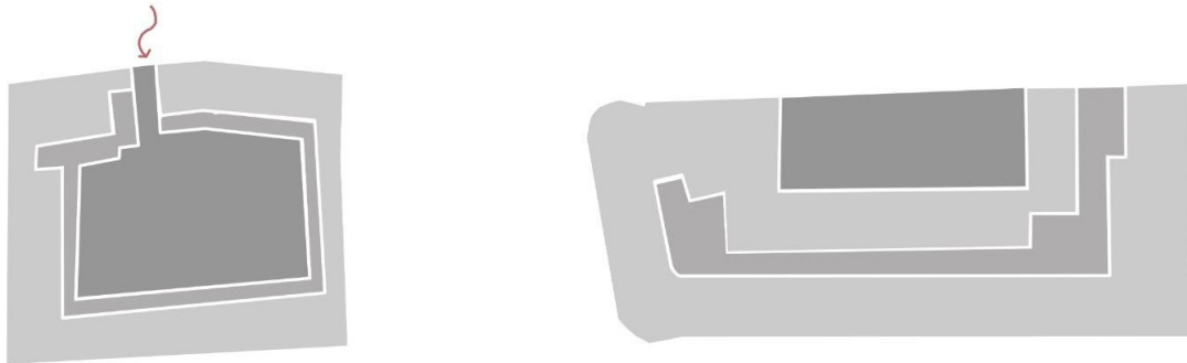
Fig. 4 și 5. Diagramă ce ilustrează diferență la nivel planimetric Hanul lui Manuc – Grand Hotel du Boulevard/ Pictures highlighting the architectural and decorative quality of the hotel's interiors during the current restoration (2023), demonstrating the attention paid over time to the values of the building's objects.