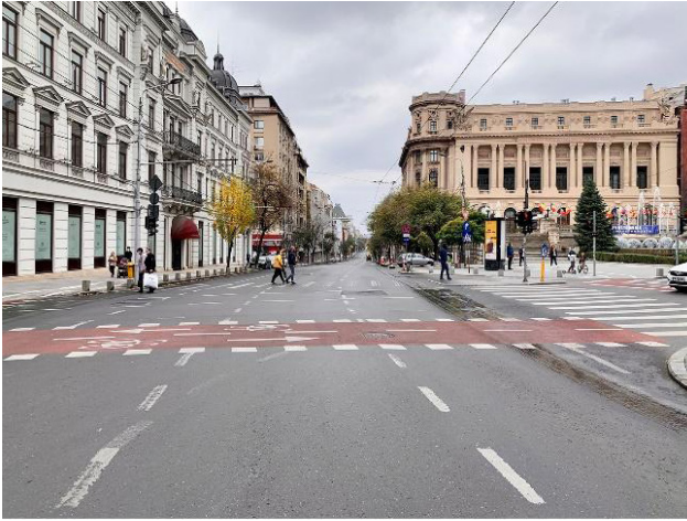
Fig. 2. Poză actuală cu Bulevardul Regina Elisabeta și cu Grand Hotel du Boulevard pe latura stângă/ Present photo of Regina Elisabeta Boulevard with Grand Hotel du Boulevard on the left side.