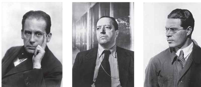
Walter Gropius Harvard