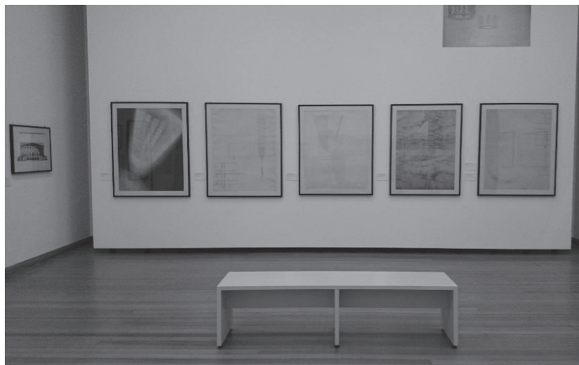
Fig. 2. Imagine din expoziția WchUTEMAS – Ein russisches Labor der Moderne, Berlin, decembrie 2014 / Image from WchUTEMAS - Ein russisches Labor der Moderne, exhibition Berlin, December 2014.