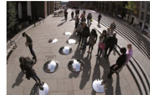
St Paul's Churchyard Experiments

Artistul Rafael Lozano Hemmer propune de mai mult de un deceniu experimente interactive încadrate în seria numită "Relational Architecture" – desfășurate în spațiul public, cu puternice influențe asupra peisajului urban. Influențele se manifestă nu numai asupra imaginii rezultate, ci și asupra reacțiilor umane, a relațiilor dintre oameni și cadrul construit și uneori și asupra conștiinței umane (atragera atenției asupra unor probleme de mediu).