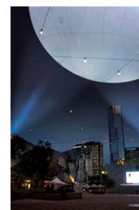
Solar Equation Experiment, by Rafael Lozano Hemmer