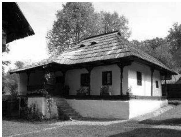
Fig. 2 Casă orășenească de sec. al XIX-lea, Câmpulung Moldovenesc, Muzeul Civilizației Populare Tradiționale ASTRA, Sibiu

Acestea sunt doar câteva elemente specifice arhitecturii populare, elemente care ascund în sine numeroase posibilități de expresie, valențe estetice și simbolice, pornind însă de la nevoi reale. Latura funcțională este de o importanță majoră în definirea lor și tocmai prin acest acord „întim dintre funcțiune, tehnologie și formă” 22 arhitectura capătă valoare.