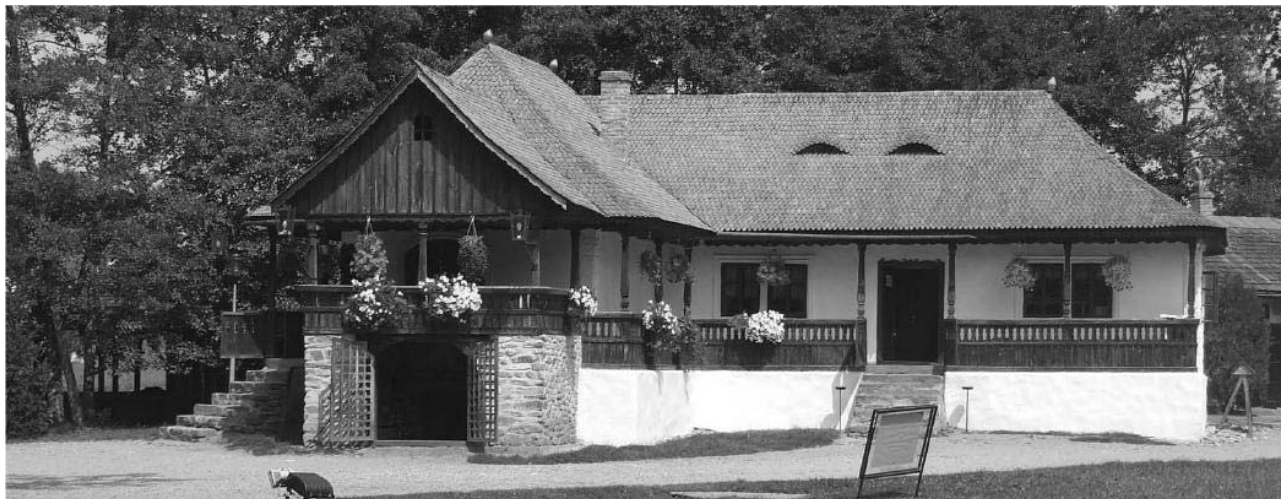
Fig. 1 Casă de olier, Livada, jud. Hunedoara, Muzeul Civilizației Populare Tradiționale ASTRA, Sibiu

Arh. Anda-Ioana SFINTEȘ, MA SNSPA BUCUREȘTI