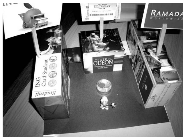
Macheta eveniment a locului

Echipa obiectelor putea opera cu fragmente, obiecte martor, obiecte sugestie. Având un potențial de sugestie foarte puternic, echipa obiectelor nu a reușit să îl valorifice în totalitate. A fost vorba, pe de o parte, despre lipsa de implicare a unei echipe prea eterogene și, pe de altă parte, aceeași apropiere de mijloacele prea mult știute ale arhitecturii (li s-a sugerat la un moment dat că poate fi vorba despre o machetă) a derutat ca și în cazul desenului. Totuși obiectul final, o machetă eveniment a locului (volume simple îmbrăcate în fragmente de pliante, bilete de teatru, un