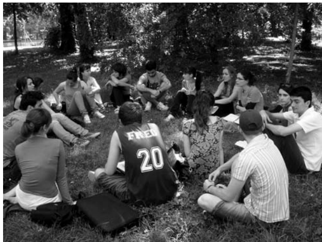
Furtuna de idei în Grădina Cișmigiu

Al doilea sens al reprezentării, redarea, reproducerea, vorbește despre un proces de exteriorizare, lucrurile sunt purtate de la mine spre lume.