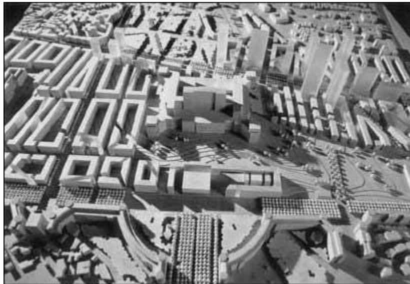
București 2000, Premiul I: Meinhard von Gerkan, Joachin Zais și echipa Fotografie după macheta din Catalogul Competiției, București, Ed Simetria, 1997, p.38, preluat din http://www.artmargins.com/index.php/2-articles/361-the-rape-of-bucharest

Pe acest teren se intenționează realizarea unei zone cu funcțiune mixtă de valență centrală cu următoarele date anunțate de dezvoltator: