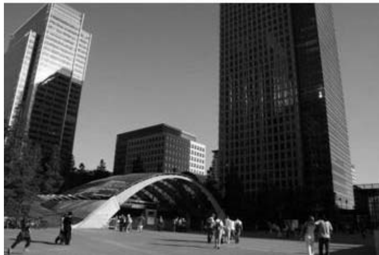
Canary Wharf, Londra

http://www.canarywharf.com/estate/estate/sebody.html