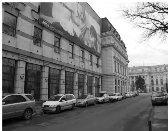
Fig. 5 Biblioteca Centrală Universitară, extindere

Păstrarea caracterului istoric prin continuarea locuirii (participarea la istorie) Armonizarea intervenției cu existentul Plasarea elementelor autentice pe o poziție dominantă Diferențierea noului de existent (textură, volum) Păstrarea conturului (liniei) clădirii Păstrarea în cât mai mare măsură a materialului existent.