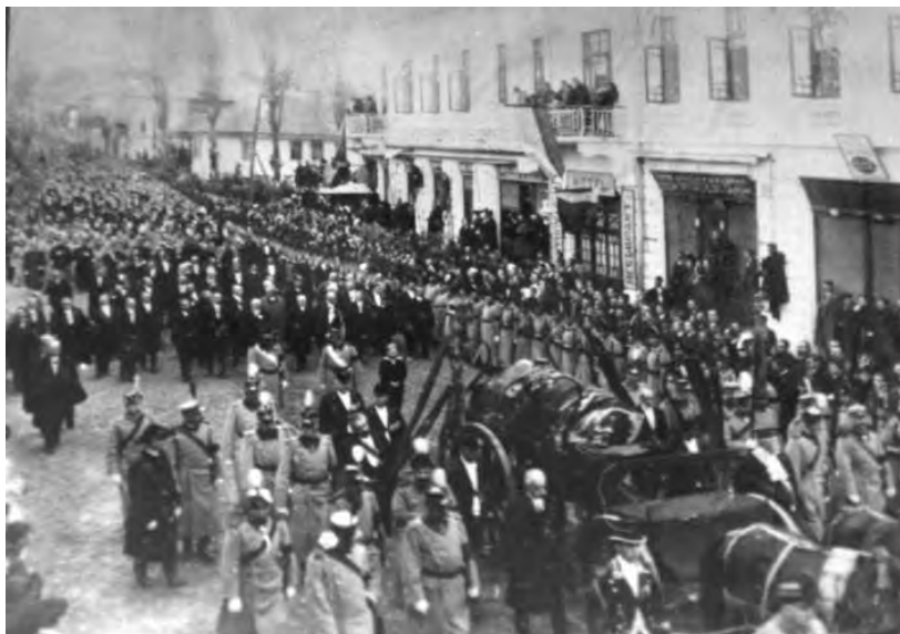
Fig. 1. Funerariile regelui Ferdinand I, Curtea de Argeș, 1927. Fotografie de epocă

Criza identității se datorează evoluției accelerate a tehnologiei, al cărei ritm depășește pu-