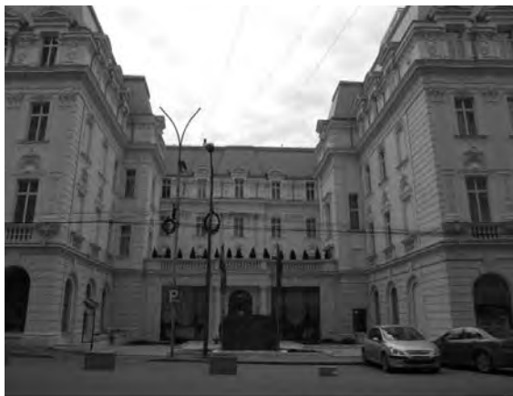
Fig. 8. Hotelul Continental

Păstrarea caracterului istoric prin continuarea locuirii (participarea la istorie) Armonizarea intervenției cu existentul Plasarea elementelor autentice pe o poziție dominantă Diferențierea noului de existent (textură, volum) Păstrarea conturului (liniei) clădirii Păstrarea în cât mai mare măsură a materialului existent.