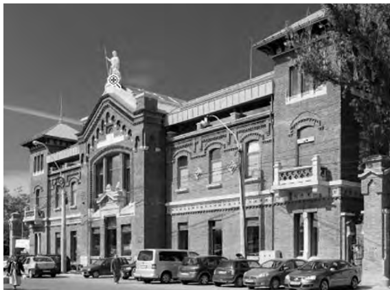
Fig. 3 Bursa de mărfuri București