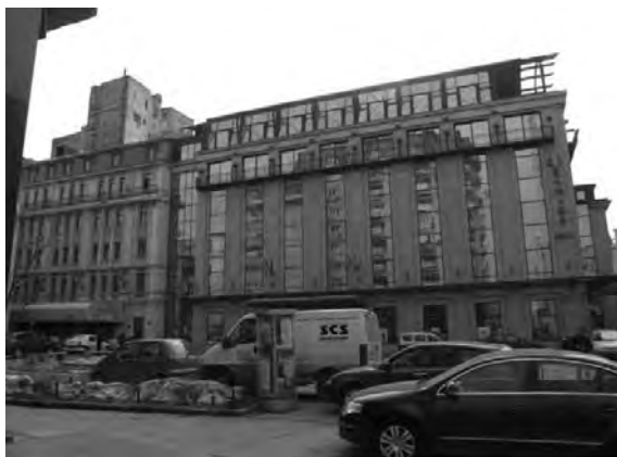
Fig. 4 Hotelul Ramada (Majestic)