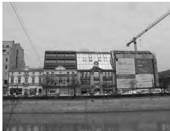
Fig. 6. Clădiri pe malul Dâmboviței, între zona Lipscani și Piața Unirii

Fig 7. Construcție de secol XIX în vecinătatea Pieței Romane