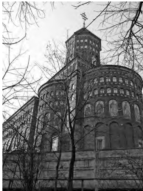
Biserica Cuțitul de Argint