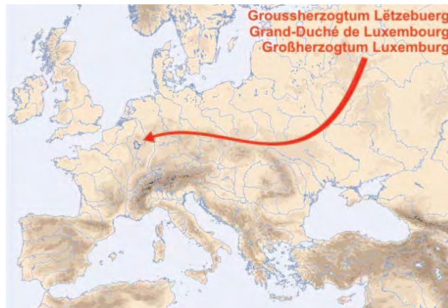
Localizarea Marelui Ducat de Luxemburg în Europa

În perioada 1764 - 1786, aproape 5000 luxemburgezi emigrează către Banat, primii emigranți fiind semnați în anul 1724. Ordonanțele din 1765 și 10 martie 1766, care urmăresc stoparea emigrației, permit doar emigrarea a trei categorii de populație: clerici în căutare de beneficii, locuitori din zonele de frontieră și locuitori luxemburgezi ai “enclavelor” din străinătate și burghezii care doreau să profite de diplomele sau de arta lor. Vârsta medie de emigrare, în general, era de 25-26 ani, aducând prejudicii recrutării regimentelor naționale de origine luxemburgheză din patria de origine. Banatul și provincia depinzând de același suveran, numai guvernul de la Viena putea decide privind sancțiunile. Marea majoritate a emigranților fiind insolubilă, nu avea nimic de pierdut, iar organele fiscale ezitau înainte de a demara acțiuni împotriva lor. (6)