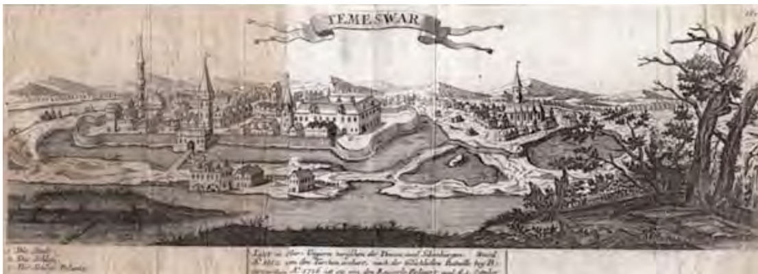
Timișoara la 1716

În secolul al XIII-lea, Timișoara este sediul comitatului Timiș și posedă un domeniu feudal, având cele "două tipuri de populație, diferențiate ca origine și structură socială, una din comunități îndeplinind o funcție administrativă, militară, comercială și în mică măsură meșteșugărească...iar așezarea rurală, locuită de țărani, (vor fi fost, poate) aserviți cetății." Între anii 1307 și 1315, castelul (reședința regală) se construiește cu meșteri italieni. În anul 1342, ca urmare a stabilirii aici a regelui Carol Robert d'Anjou (1315-1323), Timișoara este menționată cu titlul de oraș, "civitas", devenind capitala regatului ungar.