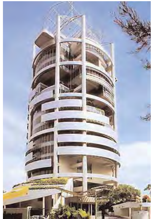
Turnul bioclimatic Menara Mesiniaga, Malaezia. Arhitect Kenneth Yeang