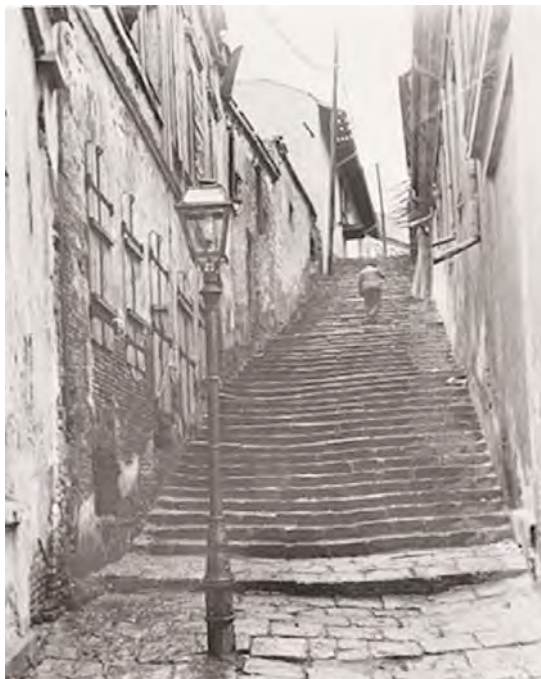
Ulicioară lângă Puțul cu apă rece, 1922 (zona parcului Palatului Parlamentului).