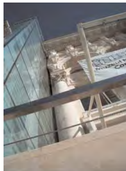
Muzeul Național de Artă Contemporană