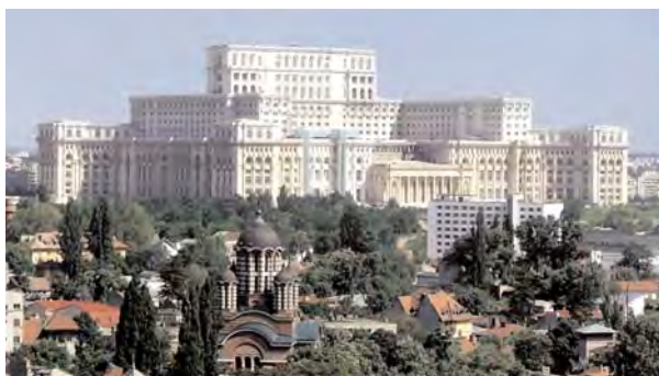
Muzeul Național de Artă Contemporană