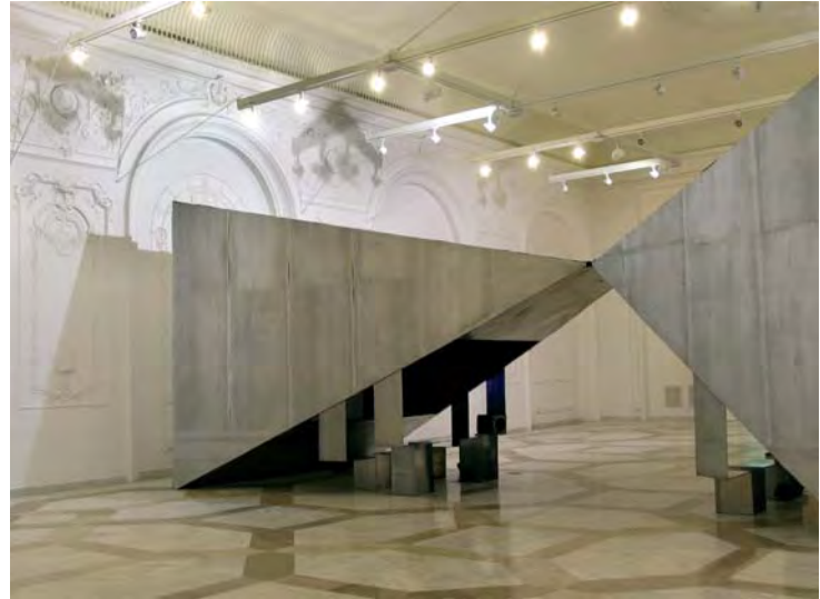
Imagini din interiorul Muzeului de Artă Contemporană

Primul pas făcut în direcția reintegrării acestei clădiri în țesutul urban îl reprezintă apariția, în interiorul ei primitor și foarte încăpător, a unui spațiu reprezentativ pentru oraș, și anume un muzeu destinat artei contemporane. Reconversia funcțională a unei părți din clădire aflată în zona posterioară, ce avea ca destinație inițială dormitoarele imense care urmau să găzduiască pe cei mai mari oameni ai țării în Muzeul Național de Artă Contemporană, conferă o nouă identitate locului. Muzeul a devenit un punct de reper pentru bucureșteni și a marcat în același timp introducerea Palatului Parlamentului în circuitul cultural al publicului larg din capitală.