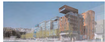
Proiectul Lyon Confluence. Place nautique, ansamblul Marignan Alliadé