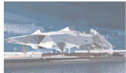
Musée des Confluences. Coop Himmelblau