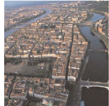
Țesutul ortogonal al zonei peninsulei

LYON se deosebește de alte mari aglomerații urbane prin prezența și forța configurației naturale a sitului. Cele două fluvii — Rhône și Saône — încadrează o peninsulă la nordul căreia se află originile orașului, între colinele vestice și câmpia estică.