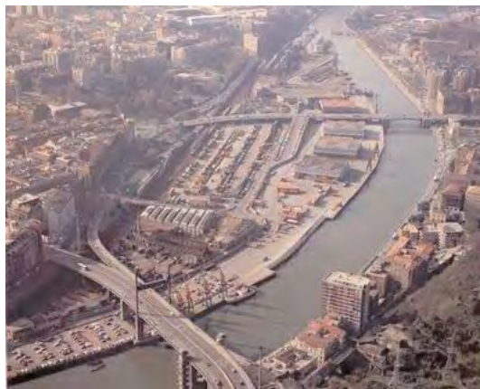
Bilbao. Zona Abandoibarra, 1995 / 2004

stâng al estuarului, între zonele Zorrozaure și Galindo, pentru ca apoi să se despartă în două peste un pod jos, pentru a trece pe malul drept. Se prevede mutarea funcțiilor portuare în portul exterior care se construiește în această perioadă. Portul interior va deveni nefuncțional, fiind propus un sistem de poduri joase care să integreze cele două maluri ale estuarului și să elimine pericolul segregării și separării prin accesibilitate și continuitate.