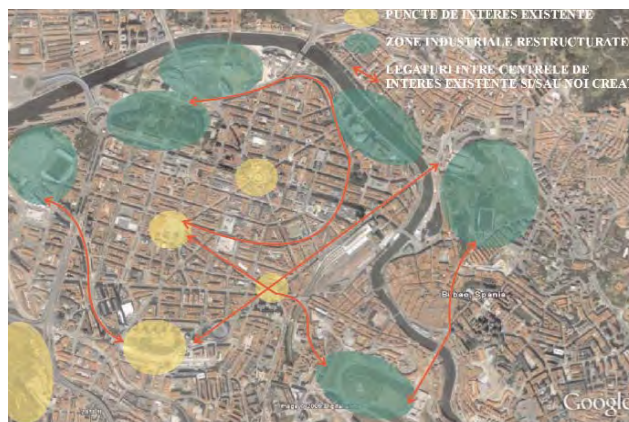
Bilbao. Restructurarea zonei aferente apei, prin crearea unei rețele de puncte de interes

Prioritatea o constituie realizarea unei axe metropolitane, bine ancorată în centrul orașului, străbătând malul