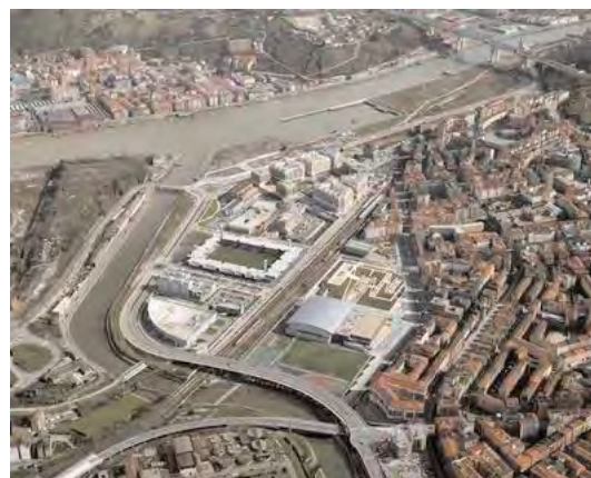
Bilbao. Zona Barak, 1995 / 2004

Zorrozaure, care acum este insulă, nu mai aparține niciunui dintre maluri, devenind o arie simbolică. Noua structură va fi completată cu drumuri ce străbat zona care fac legătura între axa metropolitană și rețeaua stradală. Unele din aceste drumuri sunt noi, altele sunt existente și vor fi transformate în artere urbane. Terenul neocupat oferă, pe de o parte, oportunitățile necesare și acceptă, pe de altă parte, condiționările impuse de către investițiile care lipsesc în teritoriu. Această arie cuprinde o întinsă zonă verde, suprafață cu deschide-