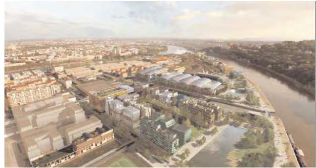
Proiectul Lyon Confluence. Intervenția din zona malului Saône-ului

gara, autostrada, etc. — proiectul urmărind desființarea treptată a acestora și realizarea continuității orașului la nivelul solului. În acest sens, au fost realizate promenade pietonale de-a lungul digului, porturi de agrement, noi poduri de legătura între maluri — constituind punctul de plecare al proiectului definit de un mare spațiu public. Spațiul emblematic a confluenței celor două fluvii a fost destinat realizării Muzeului de Istorie Naturală, concept aparținând arhitectului Coop Himmelblau.