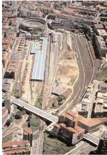
Bilbao. Zona Amezola, 1995 / 2004