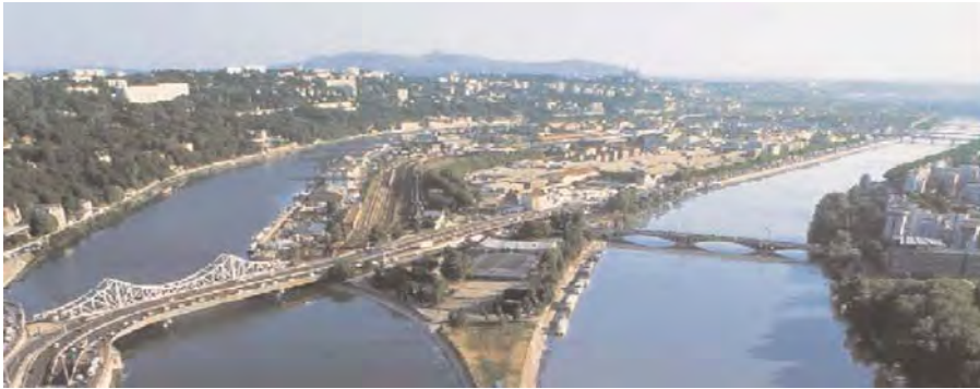
Lyon. Zona Confluenței

mișcare continuă, de schimbări rapide sau lente, cu evoluții profunde, implicând numeroase paliere ale vieții urbane. Logica acumulării istorice definește traiectorii și continuă prin tendințe sau forțe latente interpretabile. Starea unui loc asupra căruia urmează a se interveni este deja purtătoare a proiectului. În această idee proiectul urban trebuie să urmărească cu atenție istoria sitului, tendințele de dezvoltare și relaționare în teritoriu, pentru a regăsi în final identitatea locului, informațiile pe care acesta le conține.