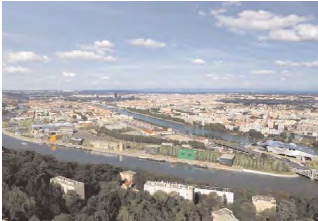
Proiectul Lyon Confluence. Propunerea de restructurare a zonei confluenței