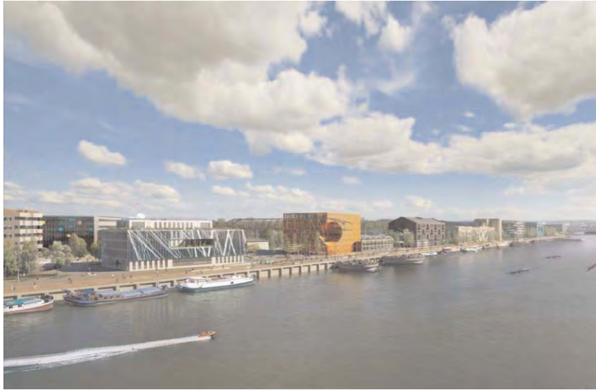
Lyon. Portul Rambaud. Docurile

Cadrul urban astfel rezultat are un conținut diversificat, pretându-se variațiilor de utilizare și flexibilității în exploatare, și înscriindu-se în același timp în tendințele trasate la sfârșitul secolului XVIII în proiectul lui Perrache. Piețele Lyon-ului, din nord în sud, trec prin etape istorice, de la mineralul din Place des Terreaux, la vegetalul din Carnot, apoi prin zona intermediară a pieței Belcourt, și se termină în piața nautică a zonei Confluenței.