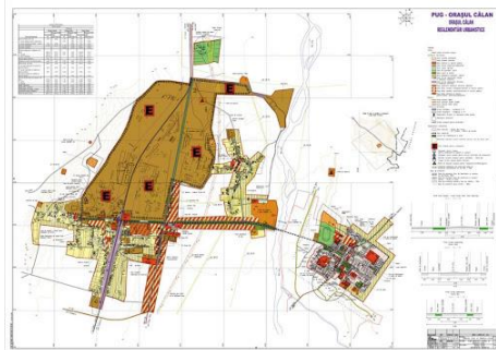
Fig. 5. Orașul Călan – PUG/Călan city - PUG