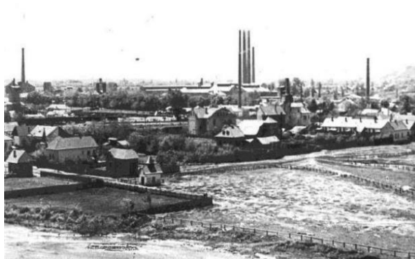
Fig. 7. Imaginea de ansamblu a uzinelor din orașul Călan – 1960/ The factories in the city of Călan - 1960