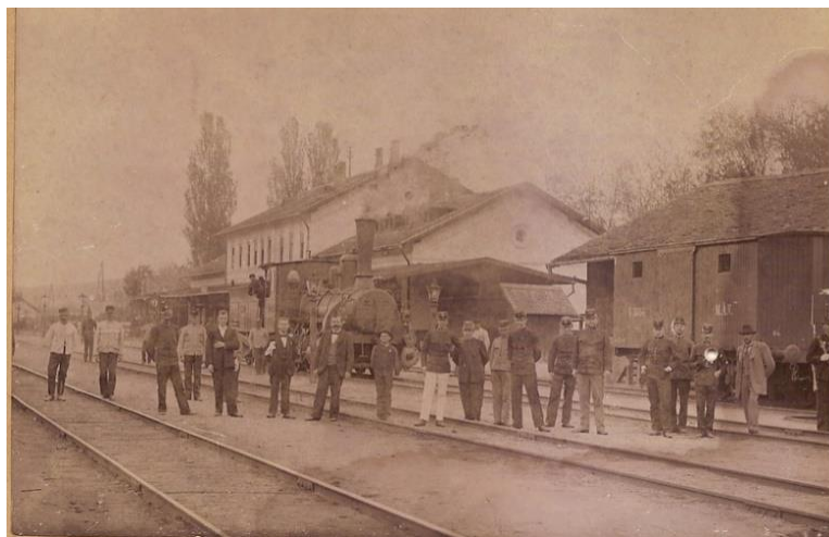
Fig. 9. Gara orașului Copșa Mică/ Copșa Mică train station

settlement. Before 1989, more than 6,500 people worked at the plant. They came from rural areas of the country or from neighboring localities. At the end of 1999, all the employees of the plant were dismissed, thus being forced to go either to the areas of origin or to the areas with a still high economic potential (Hunedoara, Deva, etc.). The desolate image of the former industrial city is accentuated by the presence of abandoned or partially abandoned blocks of flats, the skeleton of the plant, still ungreened, disused buildings, and the presence of the few people who long nostalgically for the prosperity of older days (Fig. 7). In the last decades, more than two thousand young people have gone abroad from the city's population. The cause of this mass migration was the lack of future prospects (jobs, lack of interest shown by local and national authorities) (Fig. 8).