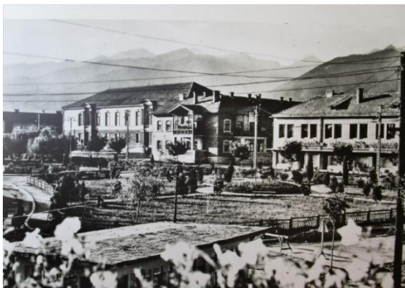
Fig. 3. Cartier rezidențial din oraşul industrial Victoria/ Residential neighborhood in the industrial city of Victoria

http://www.primariavictoria.ro/index.php/victoria/diverse/307