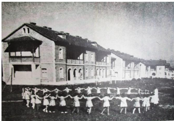
Fig. 4. Copiii oraşului Victoria/ Children of Victoria

http://www.primariavictoria.ro/index.php/victoria/diverse/307