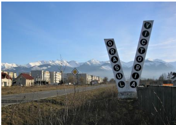
Fig. 1. Victoria City Totem