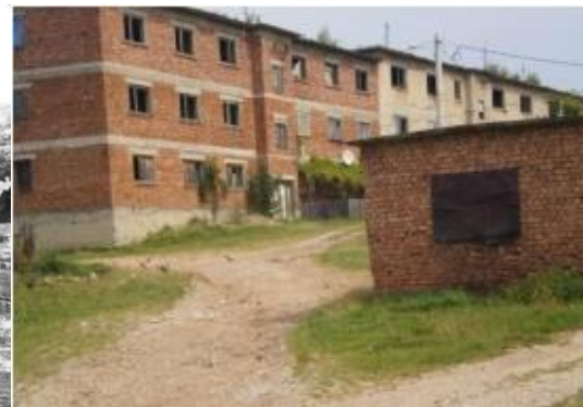
Fig. 8. Orașul Călan, Ghelari 2011 - cartierul muncitoresc/ Călan city, Ghelari 2011 - working class neighborhood

Un caz particular de oraș industrial abandonat, depopulat din România este cel al orașului Călan (Fig. 5), situat în județul Hunedoara. Orașul se bucura, înainte de anul 1989, de singurul combinat siderurgic (Fig. 6) unde se producea fonta neagră. Închiderea treptată a combinatului a determinat,