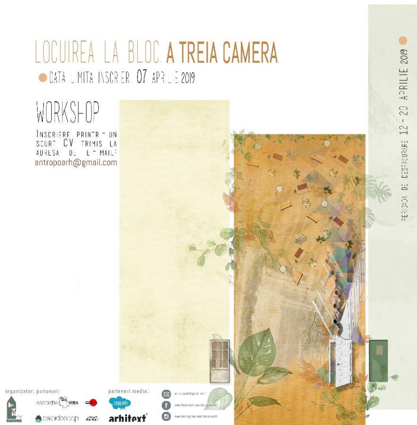
Fig. 1: Afișul workshop-ului – A treia cameră reprezentată printr-o serie de uși ca puncte de trecere către o cameră a cărei semnificație urma să o explorăm./

living in similar conditions in individual houses. Given the theme of the present article, however, the interviews falling in the last category have not been considered.