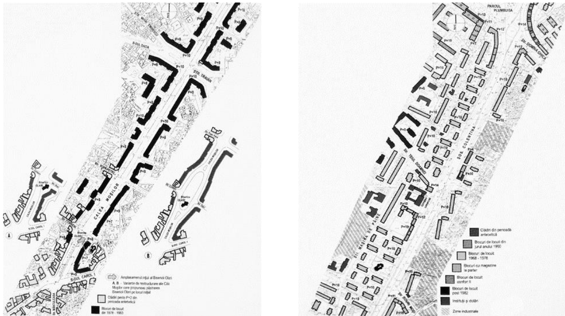
Fig. 3: Evoluția Șoselei Colentina și a Căii Moșilor cu evidențierea îndeșirilor/ Evolution of Colentina Street and of Căii Moșilor with the display of densification (Panaitescu, 2012)

Nicolae Ceausescu's gain of power in 1965 will mark the beginning of a period of radical and much more visible transformation of Bucharest. The process of standardization started by the plenaries of the Central Committee but also economic aspects (limitation of the built surfaces) will concentrate the constructive efforts towards the restructuring major traffic ways relevant at the scale of the city (Fig. 3).