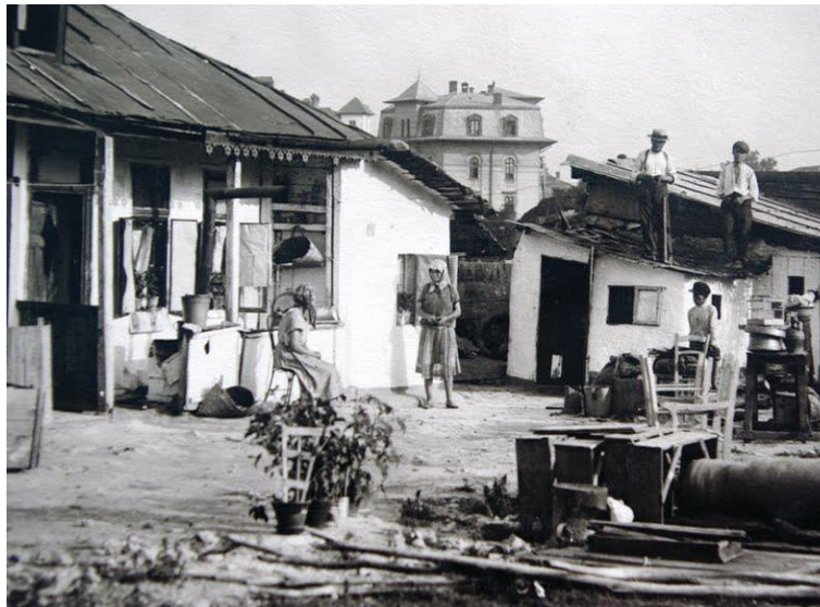
Fig. 1: Gospodărie bucureșteană de la începutul secolului 20./ Household in Bucharest at the beginning of the 20 th century.

The progressive development of Bucharest is mainly characterized by the absence of clearly defined external boundaries leading to the emergence of a particular pattern and density of occupation - through the gradual constitution of concentric, dense areas. The successive accumulations have led to the emergence of a specific type of vicinity which can be described as "the closeness - without overlapping - of unchanging places, through gestures of dwelling (by organizing, limiting); such places are those that allow individuality, concealment, protection, precisely these characteristics being those that then allow the existence of vicinity "(Ioan, 1999).