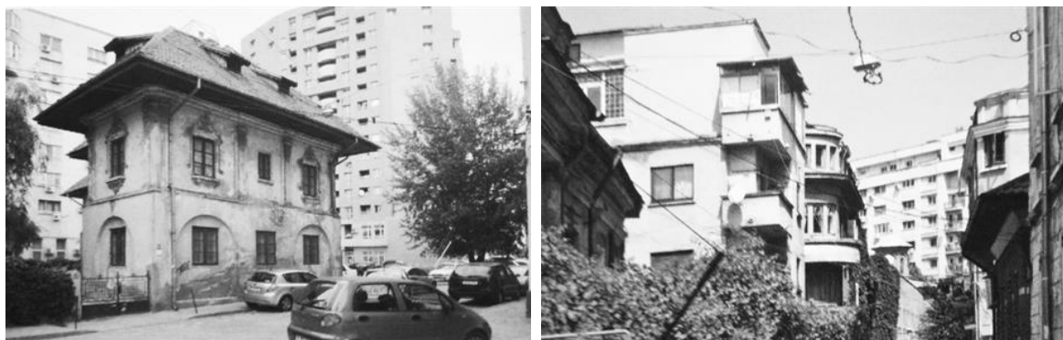
Fig. 4: Situații de tensiune și coliziune între vechiul țesut bucureștean și cortinele de blocuri/ Situations of tension and collision between the old urban fabric and the curtains of blocks

Although the danger of a monotonous urban image was understood and an attempt was made to diversify the exterior appearance of the blocks, the end result was not very different, due to the existence of a unique function - that of housing. At the same time, the way of inserting these new housing fronts has generated in numerous cases interstitial spaces in the contact areas with the pre-existing urban fabric (Fig. 4).